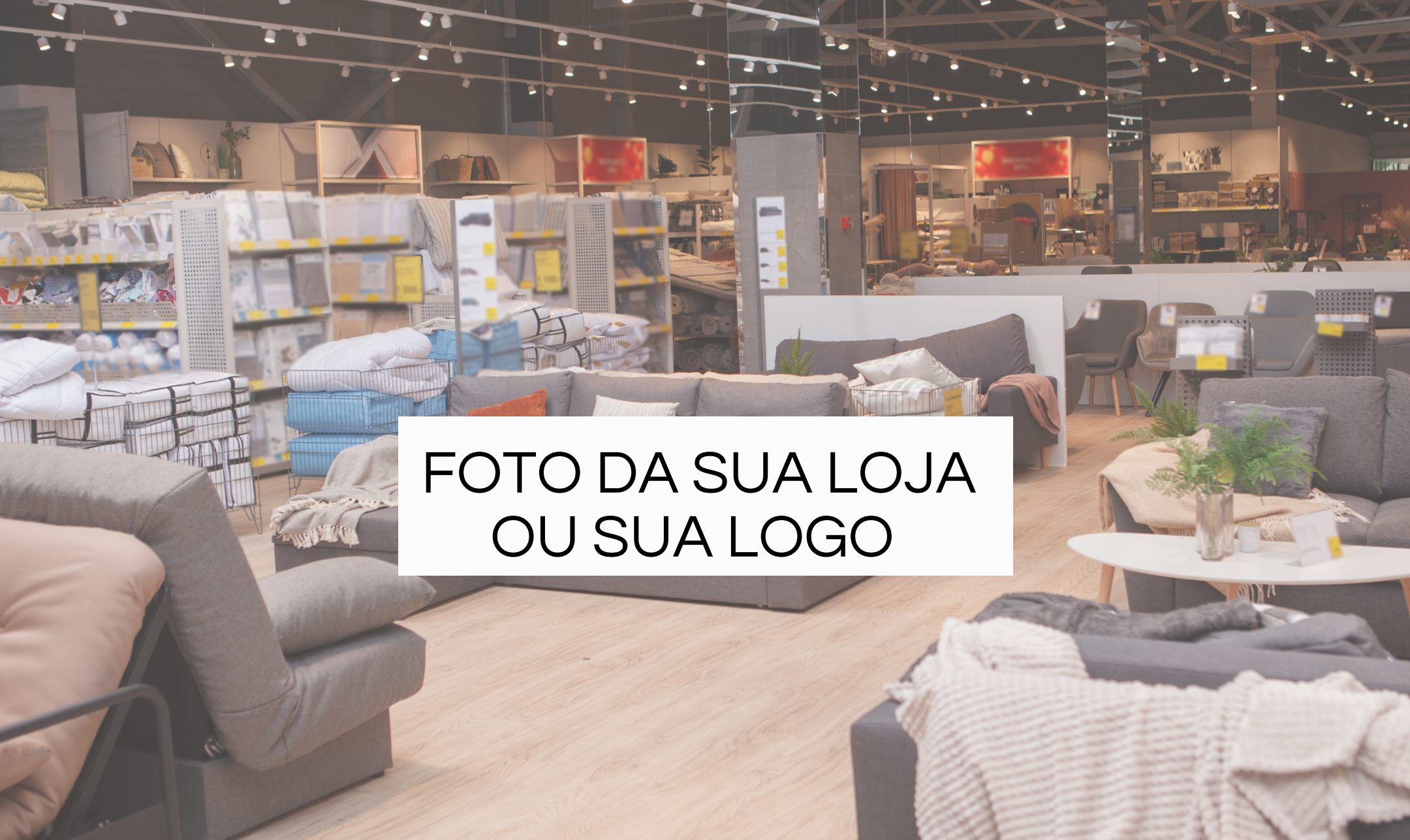
FOTO DA SUA LOJA OU SUA LOGO

Somos a [Nome da sua empresa], muito prazer [nome do cliente]